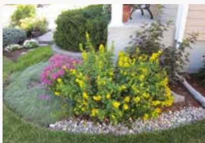
Michel Morissette, 365, rue du Plateau